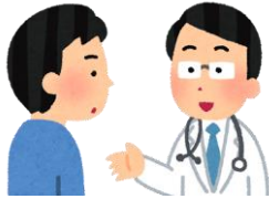
経営の早めの健康相談

経営の 早め の健康相談と考え、気をつける点を知り、改善したい習慣等の見直しに役立てます。