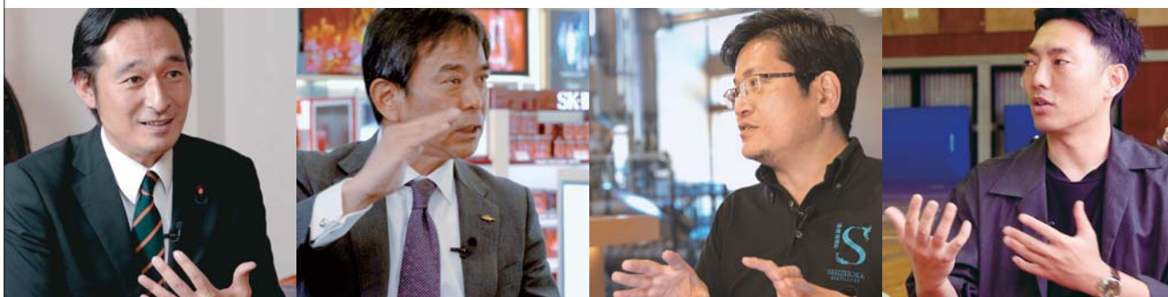
深澤陽一氏【衆議院議員 静岡県第4区選出】