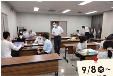
初回講座(9/8)で熱心にグループ討議に取り組む受講者ら