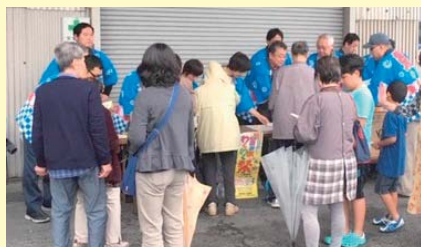
わくわく大抽選会(小鹿商店会)

の方々楽しんでいただきました。わくわく祭開催期間中は、各商店街で「わくわくハロウィン祭り」、「秋のわくわく音楽祭」、「千円均一福袋市」、「静岡版創作舞妓 ストリートファッションショー」、「わくわく大抽選会」など、大型店でも「秋の味覚フェア」をはじめとする地域や季節の特色を活かした協賛イベントが実施されました。また、参加商店街・大型店の中には、おすすめ商品が入った「わくわく福袋」の販売が行われ、多くの