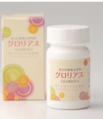
複合乳酸菌生産物質「グロリアス」

を開発しました。この商品は「顧客のオシャレを健康から実現させる」をモットーに、健康面で注目を集める乳酸菌を使用したサプリメントです。このサプリメントを服用することで、健康で美しいからだをつくることができます。