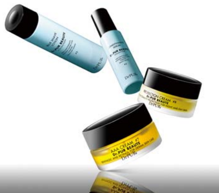
高機能総合エイジングケア化粧品「Dr.PUR BEAUTE」

「グロリアス」の特徴としては、16種の乳酸菌を動物性の物質Ω9で生成されたカプセルに内包すること、多種多様な成分を確実に腸まで届けることができる点です。乳酸菌を摂取し、腸内環境を整えることで便通が改善される他、