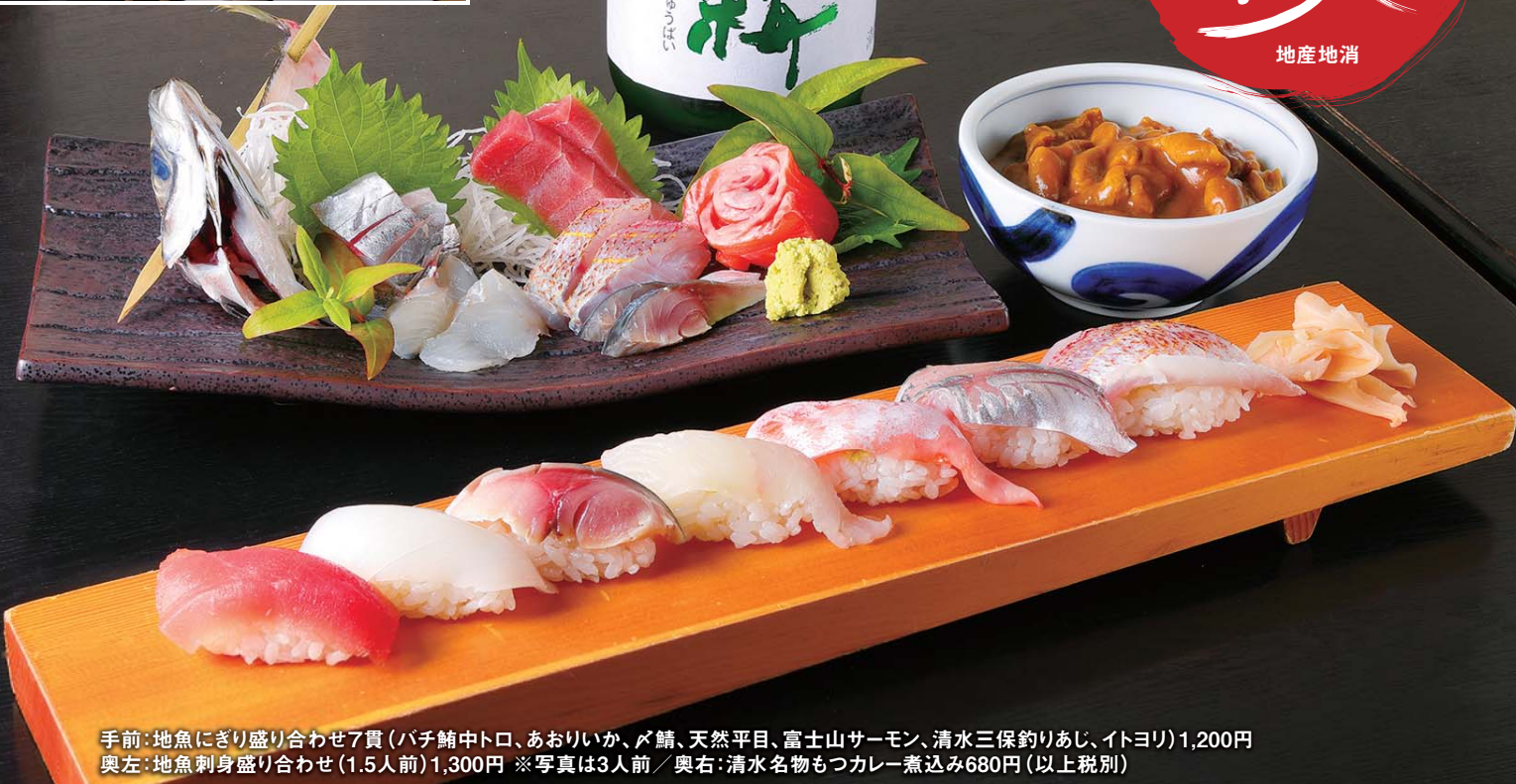
手前：地魚にぎり盛り合わせ7貫（パチ鰯中トロ、あおりいか、アジ、天然平目、富士山サーモン、清水三保釣りあじ、イトヨリ）1,200円 奥左：地魚刺身盛り合わせ（1.5人前）1,300円 ※写真は3人前 / 奥右：清水名物もつカレー煮込み680円（以上税別）