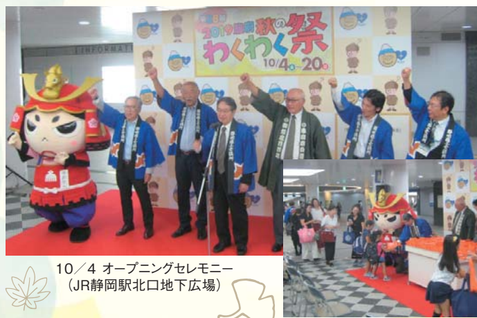
10/4 オープニングセレモニー (JR静岡駅北口地下広場)

今年で28回目を迎えた「駿府秋のわくわく祭」が、10月4日(金)～20日(日)までの計17日間開催されました。静岡市内の商店街・大型店・個店・商工会が一体となり、共同懸賞企画協賛イベント・福袋販売等を実施しました。