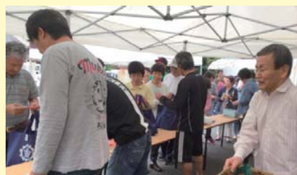
千円均一福袋市(静岡市清水商工会 由比支所)