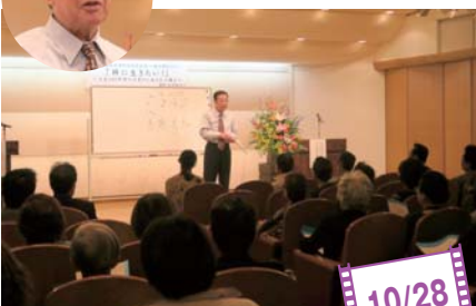
●熱心に耳を傾ける参加者