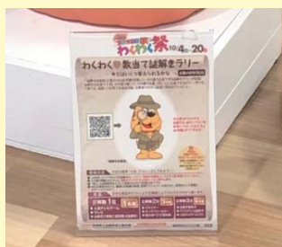
わくわく数当て謎解きラリー

方々が来店し購入されました。さらに共同懸賞企画として、期間中に参加店で一定額以上のお買い物を買ったお客様に「わくわくスピードくじ」を引いていただき、日頃の感謝を込めて「富士山静岡空港発着ペア旅行券」や「ホテルペアディナー券」などの賞品を贈呈しました。このくじと一緒にスマートフォンでスキャンし、活用した「わくわく数当て謎解きラリー」も実施しました。この謎解きラリーは、各参加店にあるイラストを探してスマートフォンでスキャンし、答えとなる謎を解くと応募できる企画で、抽選10名様に賞品を贈呈しました。