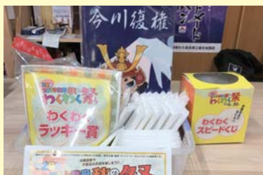
わくわくスピードくじ

の方々楽しんでいただきました。わくわく祭開催期間中は、各商店街で「わくわくハロウィン祭り」、「秋のわくわく音楽祭」、「千円均一福袋市」、「静岡版創作舞妓 ストリートファッションショー」、「わくわく大抽選会」など、大型店でも「秋の味覚フェア」をはじめとする地域や季節の特色を活かした協賛イベントが実施されました。また、参加商店街・大型店の中には、おすすめ商品が入った「わくわく福袋」の販売が行われ、多くの