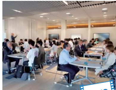
●積極的に意見交換が交わされた交流会の様子