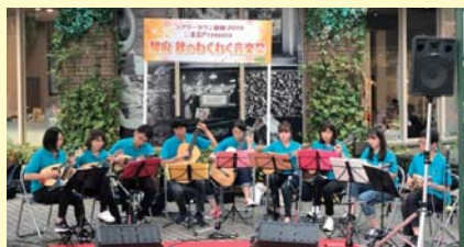
秋のわくわく音楽祭(御幸町発展会・伝馬町発展会・鷹匠一丁目商業発展会)

開催初日は、JR静岡駅北口地下広場にてオープニングセレモニーを行いました。今川義元公生誕五百年祭推進委員会公認広報大使の「今川さん」も登場し、ステージイベントではアコースティックギターの演奏や子供たちのダンスが披露された後、各参加商店街と大型店の代表者から、期間中の催事についてPRしていただきました。最後に、わくわく祭参加店の商品が入った福袋を100名様限定で無料配布し、多く