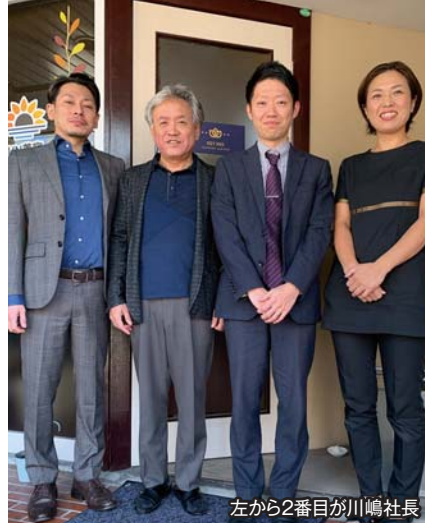
左から2番目が川嶋社長

静岡商工会議所を上手に利用されている会員の皆様から、 会議所活用法をご紹介します。