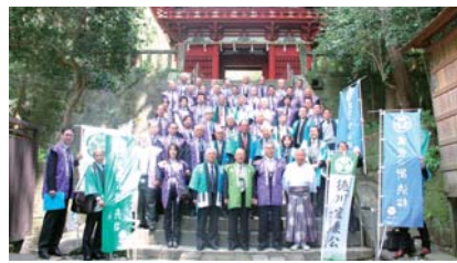
●大御所の地 静岡視察会に60名が参加

徳川時代を改めて研究・発信しています。また、江戸時代の職人たちの技術が起源とされる様々な地場産業への理解を深めるため、平成22年度からモニターツアーを実施。雑具や藍染めといった伝統産業等、静岡市で育まれた産業を体感してもらい、リピーター客の増加につなげようと、商品化に向けた検討を進めています。