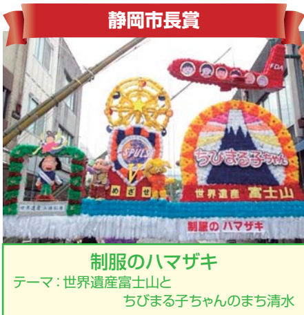
静岡市長賞 制服のハマザキ テーマ：世界遺産富士山と ちびまる子ちゃんのまち清水