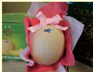
袋井産温室クラウンマスクメロン

ンアドバイザーとジュ ニア野菜ソムリエが 丁寧にご案内いたし ます。メロンの最高峰 袋井産クラウンメロン や磐田産アローマメ ロンなど食べて美味 しい、もらって嬉しい ものを扱っています。