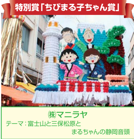
特別賞「ちびまる子ちゃん賞」 (株)マニラヤ テーマ：富士山と三保松原と まるちゃんの静岡音頭

第61回清水七夕まつりが7月4日から7日の4日間にわたり開催され、48万人が訪れました。竹飾りコンクールは、会場内に飾られている竹飾りを審査員が巡回して採点し、七夕らしい優美で風雅な作品や、斬新な創意工夫のある作品を表彰するものです。また昨年に引き続き、特別賞「ちびまる子ちゃん賞」も表彰しました。今年、上位に入賞した作品をご紹介します。