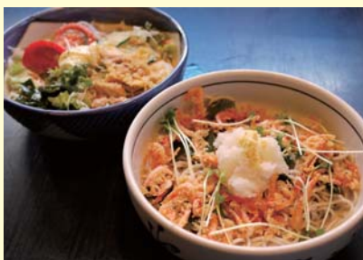
サラダそば800円(税込)、桜おろし800円(税込)

の入ったサラダ蕎 麦も、すりごま香ば しく清涼感たっぷ りです。日替りラン チ(750円)はポリ ューム満点。メイ ンのほか、麺類、小 鉢、サラダ、ライス が付いています。