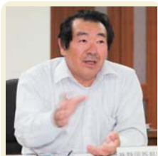
(株)静岡西部建設 工事部部长

注3 就業者数は年平均。平成23年度は被災3県(岩手県・宮城県・福島県)の結果について補完的な推計を行い、全国結果を算出。