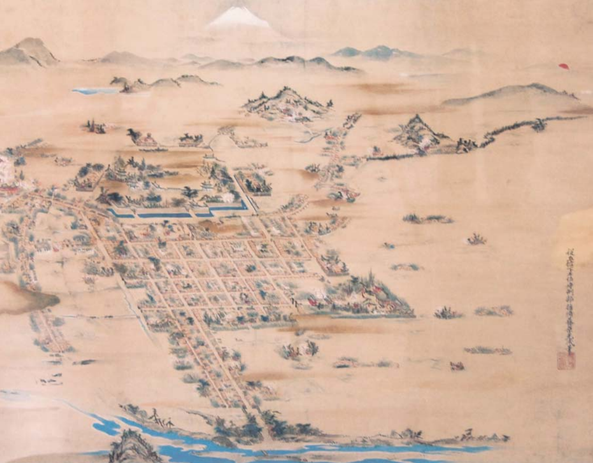
静岡市指定文化財「駿府鳥瞰図」土佐光成作。18世紀初頭(1707年噴火の宝永山を描写)。原本所蔵:駿府博物館(公益財団法人 静岡新聞・静岡放送文化福祉事業団)。家康没後、駿府城天守閣は焼失し、人口は15万から1万に減少。

家康は、平和のシンボルに富士山を導入し、大胆な都市計画を行った。元東京都立大学教授の桐敷真次郎氏は、論文「慶長・寛永期駿府における都市的景観設計および江戸計画との関連」で位置・角度・高さなど数学を駆使して、その実像を明らかにした。それは富士山が無言で、城と城下町を