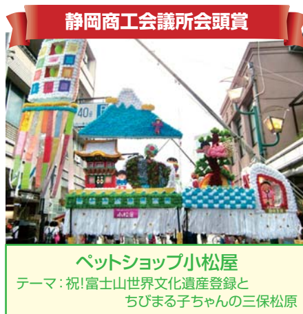
静岡商工会議所会頭賞 ペットショップ小松屋 テーマ：祝！富士山世界文化遺産登録と ちびまる子ちゃんの三保松原

問合せ先：清水七夕まつり実行委員会(静岡商工会議所清水事務所内) TEL.054-353-3401