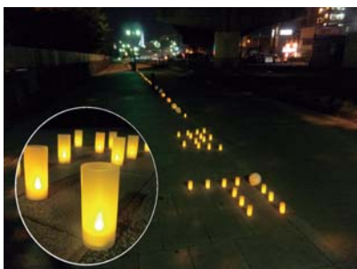
•清水港線跡自歩道に設置されたランプシェード

今年度、当所が静岡市から委託を受け実施しているウオーターフロント活性化検討事業の社会実験として、清水港線跡自歩道に、LEDキヤンドルライトと手作りランプシェードを並べ、魅力ある光の空間の演出をしました。