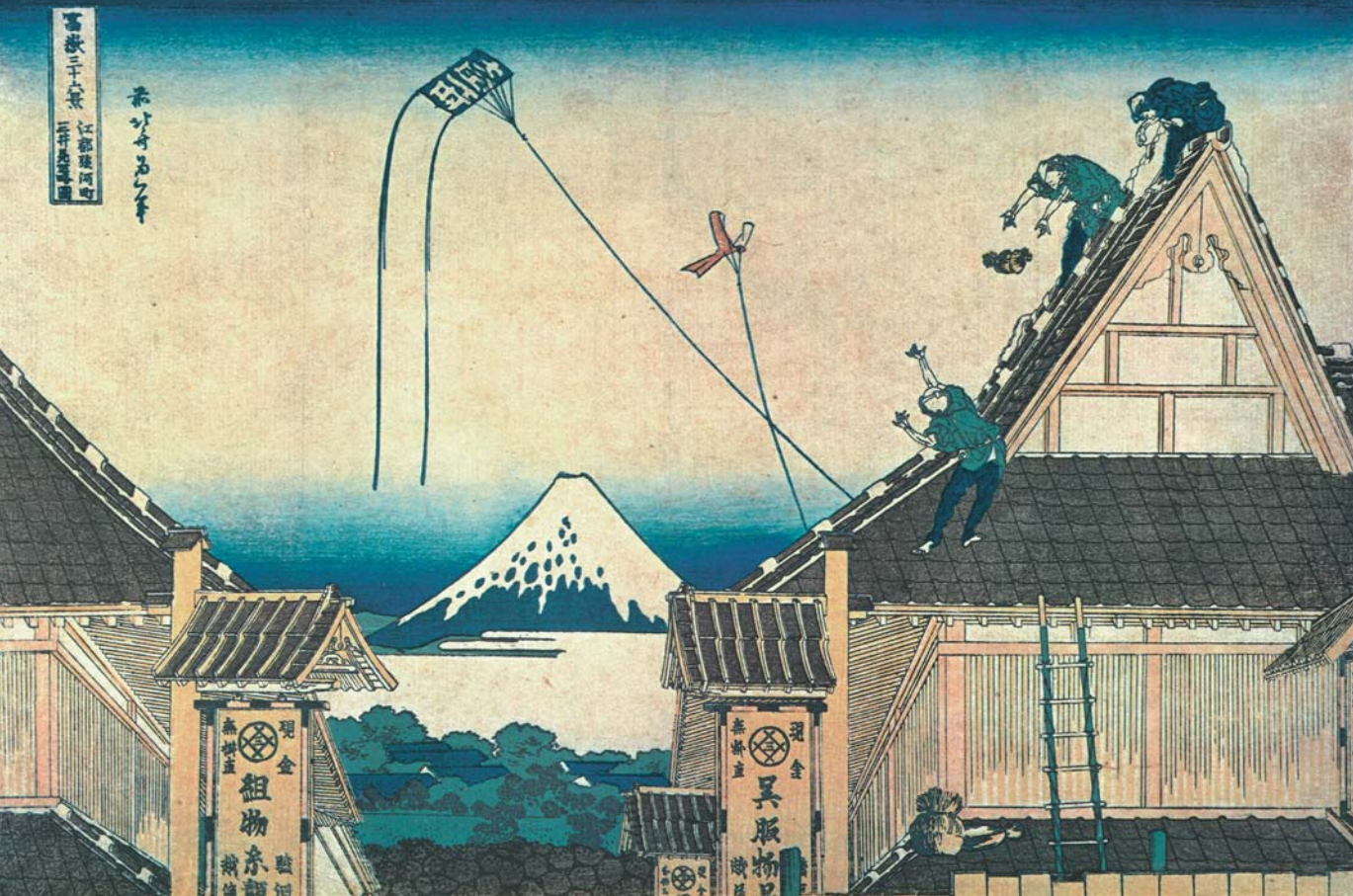
富嶽三十六景「江都駿河町三井見世略図」葛飾北斎作。 駿河町(現・東京都千代田区日本橋室町2丁目、三越の所在地)からは、富士山が美しく見えた。