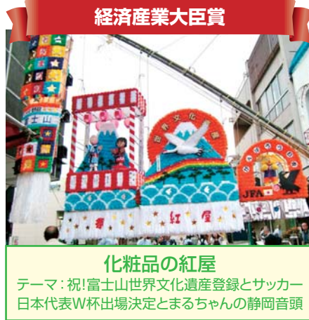
経済産業大臣賞 化粧品の紅屋 テーマ：祝！富士山世界文化遺産登録とサッカー 日本代表W杯出場決定とまるちゃんの静岡音頭