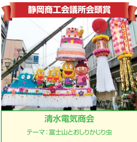
静岡商工会議所会頭賞 清水電気商会 テーマ：富士山とおしりかじり虫