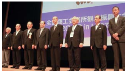
●授賞式を岩手県盛岡市で開催

同賞は、地域の個性が光り、他地域の範となる観光振興活動を行う商工会議所を顕彰する制度で、毎年実施されています。