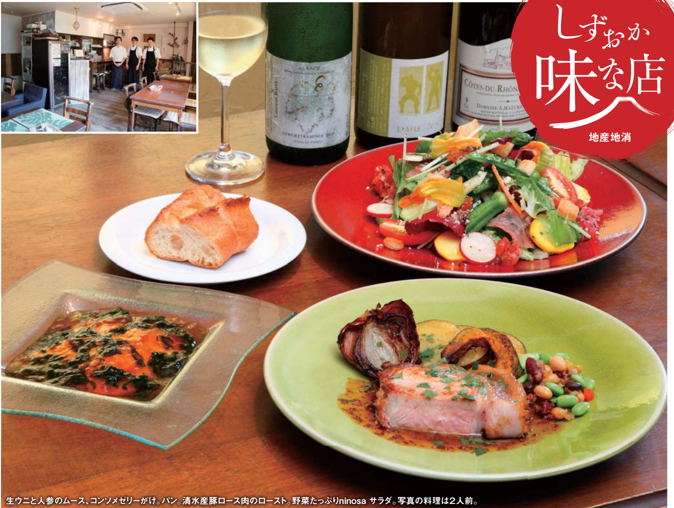
生ウニと人参のムース、コンソメゼリーがけ。パン。清水産豚ロース肉のロースト。野菜たっぷりninosa サラダ。写真の料理は2人前。