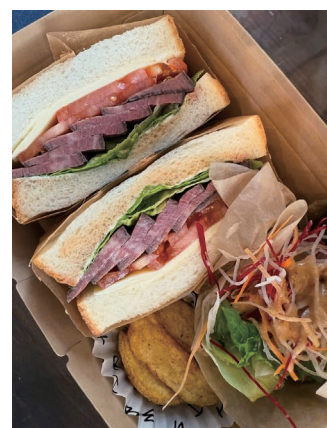
サンドイッチ弁当(キッチンカー)