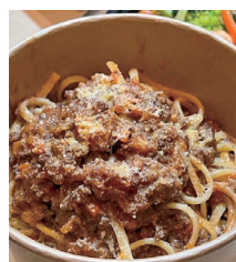
自家製ミートソースのパスタ (キッチンカー)