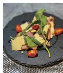
自家製鴨スモークと スモークチーズ(店舗)