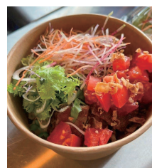
ステーキ丼(キッチンカー)