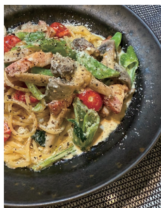
ボルチーニとベーコンのクリームパスタ (店舗・時期による)