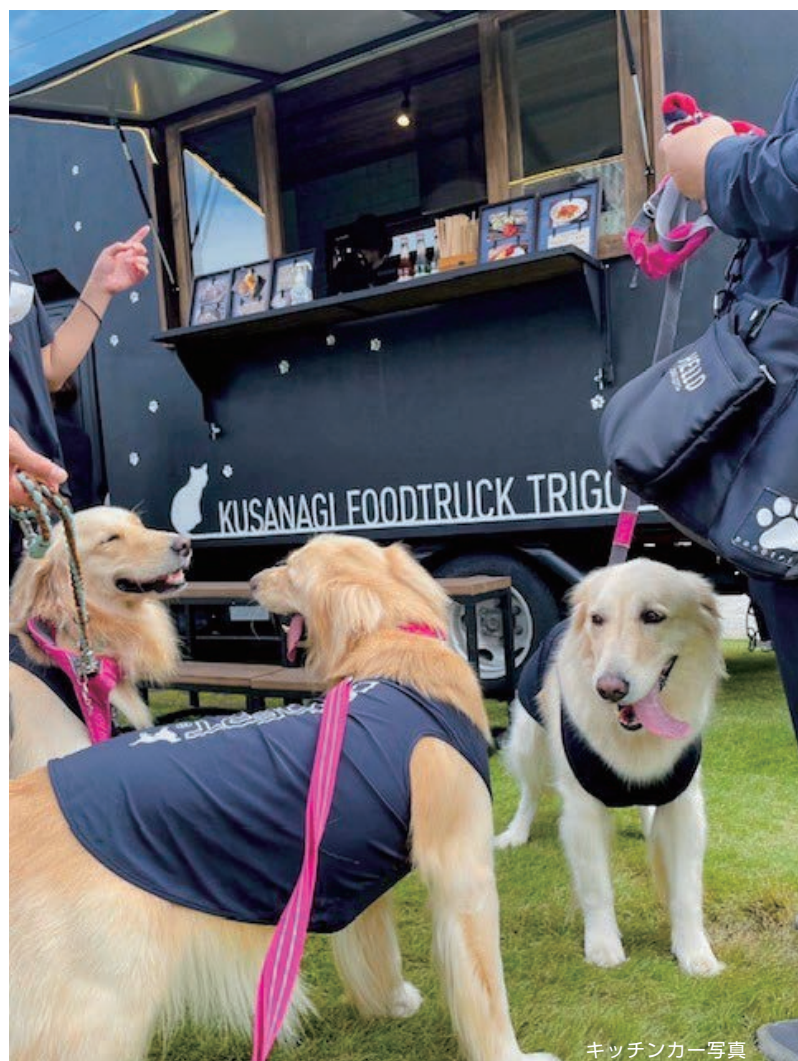
キッチンカー写真