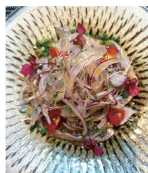
ピンチョウマクロの カルパッチョ(店舗)