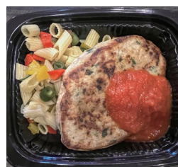
わんバーグ(キッチンカー)