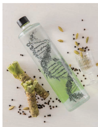
静岡の美味しいお寿司や お刺身には、ピリリと