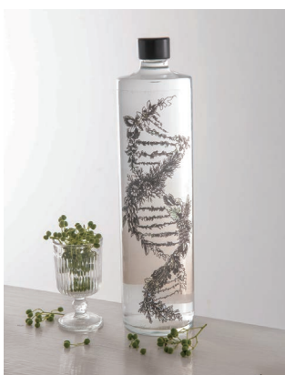
ジューシーでふわふわの 鰻重や和食には、キリッと