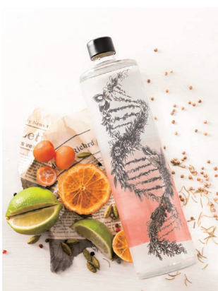
静岡のいろんな柑橘を使用した、 優しい口当たりの