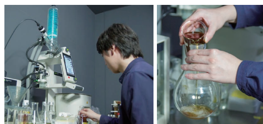
研究室だからその分析力で、豊かな香りのジンを 開発しています。