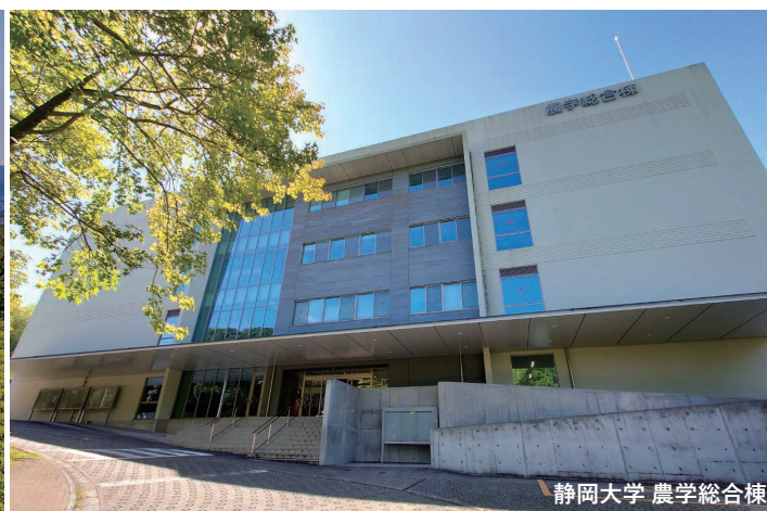
静岡大学 農学総合棟