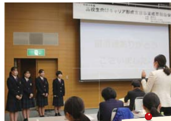
発表を行った高校生と 講師の様子