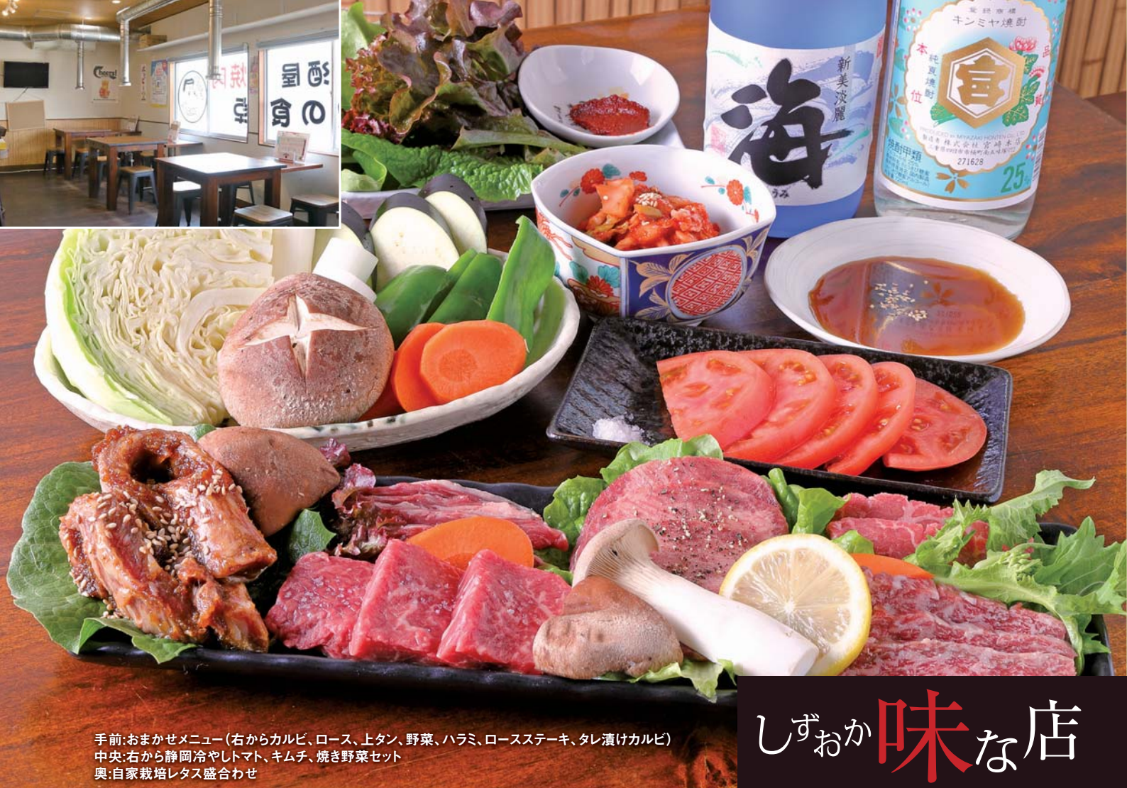
手前:おまかせメニュー(右からカルビ、ロース、上タン、野菜、ハラミ、ロースステーキ、タレ漬けカルビ) 中央:右から静岡冷やしトマト、キムチ、焼き野菜セット 奥:自家栽培レタス盛合わせ