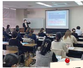
講師の説明に 熱心に耳を傾ける 受講者