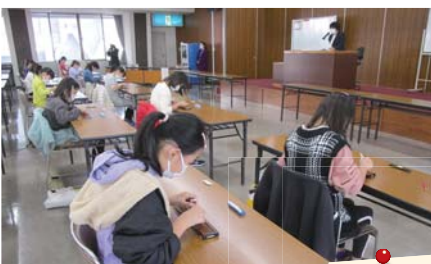
競技開始前の指ならしの様子