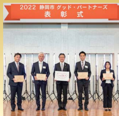
静岡市グッド・パートナーズ表彰式(2023.2.1)

静岡市では、様々な分野で地域を牽引する企業の表彰事業や、女性が企画・開発した優れた商品の認定事業を行っています。令和5年2月にグッド・パートナーズ表彰式を開催し、5グループ、計10社、3商品が受賞・認定されました。今回は、そのうち4分野の受賞企業・認定商品をご紹介します(50音順)いたします。