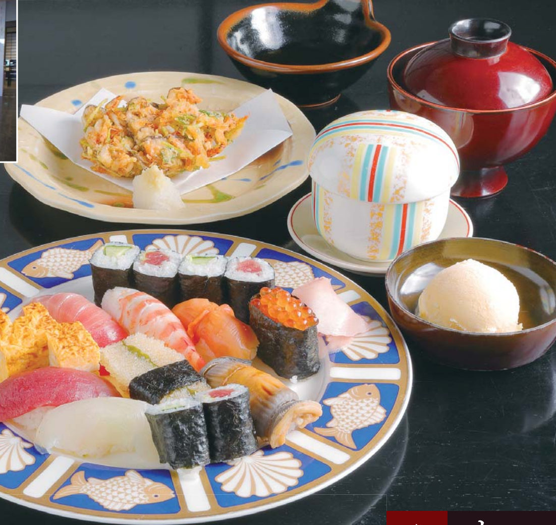
贅沢コース 5,500円(手前中央:特上寿司、手前左:サラダ、手前右:デザート / 奥中:桜えびのかき揚げ、奥右:茶碗蒸し、椀物)