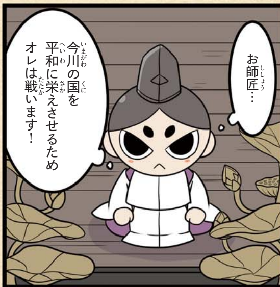
いまがわうじざね 今川氏真