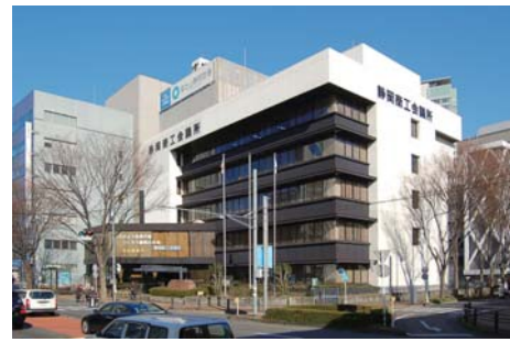
静岡商工会議所会館