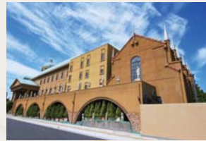
マナーハウス・エリザベト 静岡市清水区辻1-7-1 TEL.054-366-3111