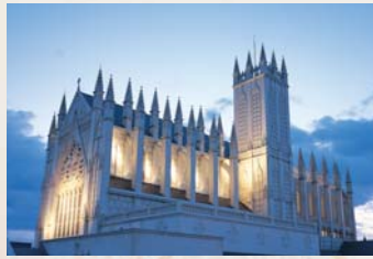
ロイヤルセントヨーク 静岡市駿河区寿町6-14 TEL.054-203-3877