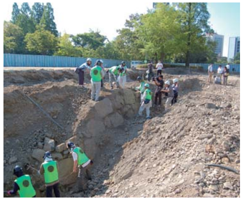
駿府城天守台発掘現場