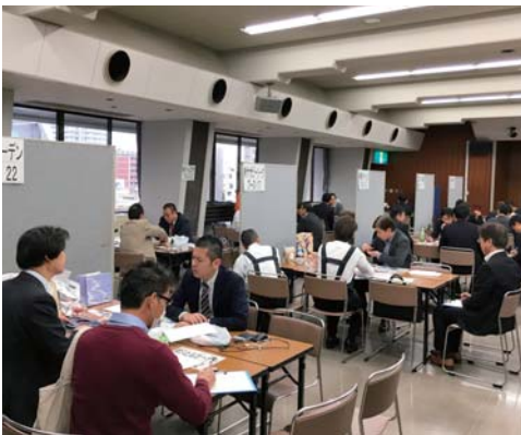
県内10商工会議所合同個別商談会