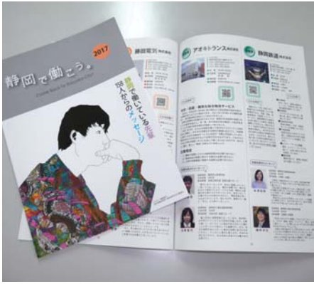
市内15高校同窓会協力による就職支援情報誌