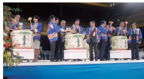
・国会議員・知事・市長・正副会頭による鏡開き

常議員によるサプライズステージや芸妓の踊りマゲロ包丁式等が行われたほか、参加者全員に景品が当たる福くじで大いに盛り上がりました。