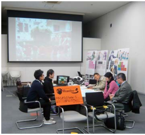
・ドローン空撮体験ワークショップの様子

期間中は、プライバシーマーク取得支援、事業承継など入居者によるビジネスセミナーやドローン空撮体験ワークショップなども同時開催し、事業の課題解決や新事業のアドバイスをを行いました。