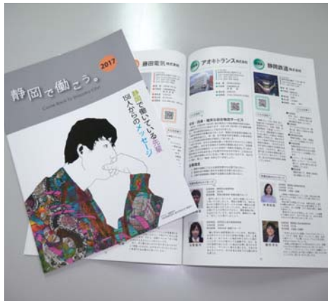
・地元企業で働く魅力が満載

静岡市内15高校の同窓会と協力して、地元就職・Uターン就職の推進・支援を目的に、会員企業82社の情報と併せて同社で明るく元気に働く地元出身高校先輩達のメッセージを掲載した企業情報誌「静岡で働こう。2017」を2万部発行しました。同窓会ルートを活用しての発送により地元企業で働く魅力を卒業生に向け発信しました。