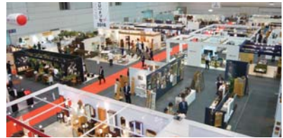
• 県内の家具メーカーなど70社が新作を展示