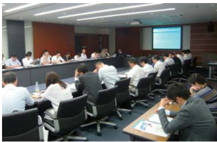
• 大和多氏の講演の様子