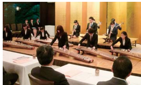
• 3大学の学生が日頃の練習の成果を披露。

静岡伝統芸能振興会平成28年度総会を開催しました。総会のオープニングでは、静岡大学・静岡県立大学・常葉大学の3大学合同による邦楽が披露されました。総会後の懇親会では芸妓衆による踊りと静岡若駒会の木遣を披露していただきました。