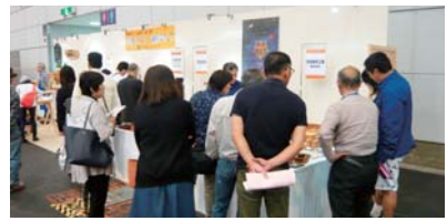
• 来場者で賑わう駿河ものづくりフェアの展示ブース

駿河ものづくり・伝統産業フェア(製造業部会)が今回初めてブース出展し、駿河指物や漆器、仏具など伝統工芸品の展示・販売を行いました。