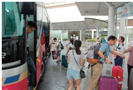
続々と降りてくる中国人観光客

保松原を経て16時55分に静岡駅へ到着します。土・日・祝日の運行で、昼食代、拝観料、ロープウェイ運賃、安倍川餅の土産付で7千円。前日の16時30分までに電話0542520505へご予約ください。