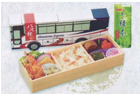
高速乗合バスの車内限定販売「静岡名産弁当」