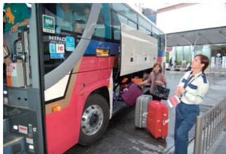
中国人観光客を出迎える中国人の案内係