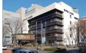
静岡商工会議所会館

昭和55年静岡市役所採用。平成24年度から経済局長、平成26年度から葵区長。昭和30年生まれ、60歳。