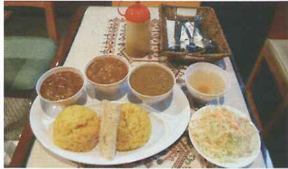
ベンガルカレー3種盛 700円(税込)

バン格拉デシユの 家庭料理を召し上がれ ベンガルカレーは、油も小麦粉も使わないので、胃にもたれず、さっぱりとした味。手作りするバイスが上品な香り。ランチタイムセット500円。営業時間11時～24時。年中無休。