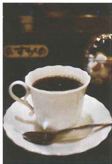
すがのブレンド 1杯 400円(税込)

(株)ロリ工常盤家 〒424-0066 静岡市清水区七ツ新屋553 TEL 054-345-8400 FAX 054-346-5924 E-mail tokiwa@laurier.co.jp