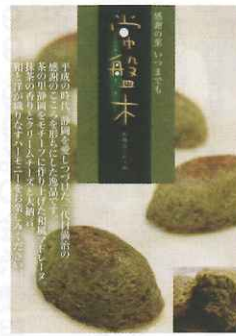
1ヶ 80円(税込) 12ヶ入り 1,060円(税込)

ベンガルキッチン 〒420-0852 静岡市葵区紺屋町4-12 (ドン・キホーテの東向側) TEL 090-6596-2608