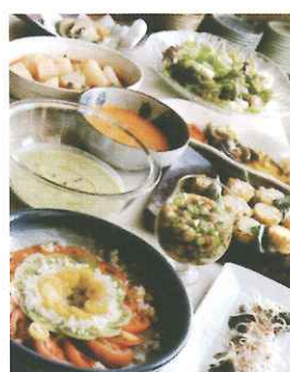
ディナー 700円(税込)~ ランチバイキング 1,250円(税込)

自家栽培の無農薬・減農薬野菜の料理をビュッフェ形式でお出しします。(大人700円、小中学生400円、幼児200円)大地の栄養を吸って育った野菜の味は格別、旨さが段違いです。ぜひご賞味あれ!