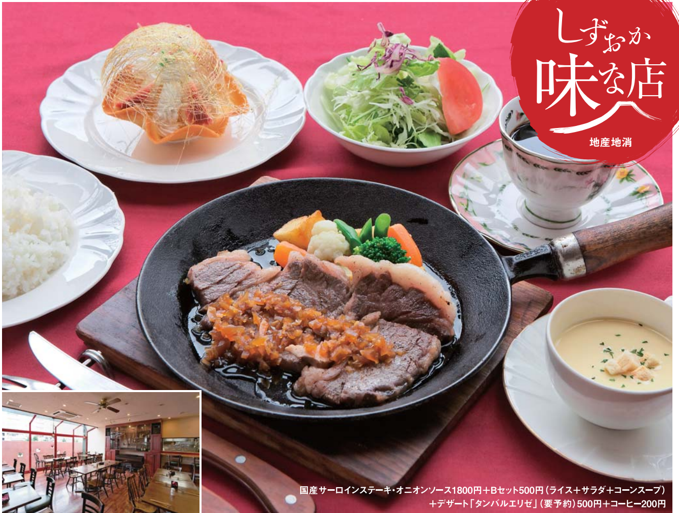
国産サロインステーキ・オニオンソース1800円+Bセット500円(ライス+サラダ+コーンスープ) +デザート「タンバルエリゼ」(要予約)500円+コーヒー200円