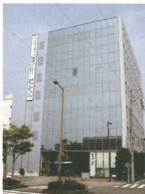
静岡市清水産業・情報プラザ