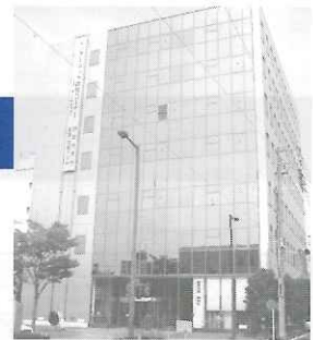
静岡市清水産業・情報プラザ